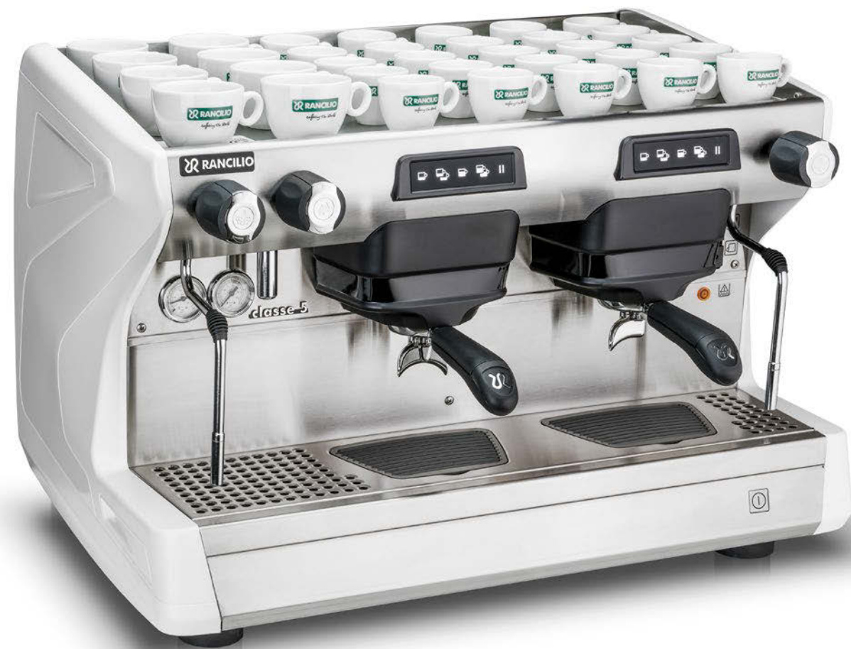
Classe 5 USB 2 gr