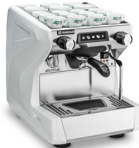
Classe 5 USB Tall 1 gr

Większość czynności serwisowych można wykonać od przodu urządzenia z łatwością zdejmując tacę lub panel przedni.