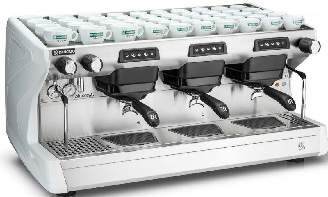
Classe 5 USB 3 gr

Nowoczesne i wyrafinowane panele boczne, obszerne osłony oraz ergonomiczna powierzchnia robocza gwarantują baristom komfort i wygodę. Technologia Metal Dome zastosowana w panelu sterowania zapewnia przyjemne i harmonijne wrażenia dotykowe.