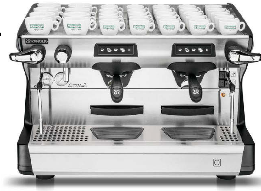
Classe 5 USB Tall 2 gr

Classe 5 makes the very best, most intelligent use of advances in technology, resulting in a machine that beats its competitors hands down. Available from 1 group to 3 brewing units, USB or semi-automatic versions, anthracite black or ice white. When space is at a premium, the 2-group COMPACT version provides the same performance in a housing only 24 inch (61 cm) wide. Rancilio LAB has developed the TALL version also for this product line. Compared to the standard version, the brewing units are raised, making it possible to use glasses up to 14.5cm in height.