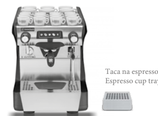
Taca na espresso Espresso cup tray