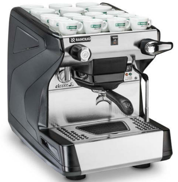
Classe 5 S1 gr

Most maintenance operations can be done quite simply from the front of the machine just by removing the easy to handle drip tray or front panel.